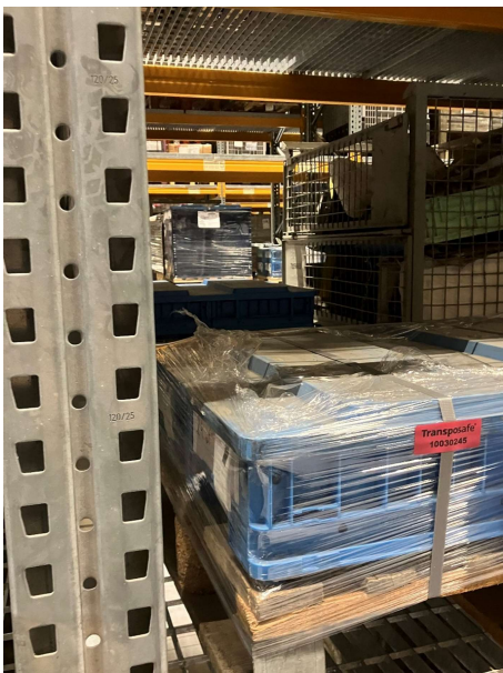
Bsp.23112332967_Gehaeusedeckel_Gitterbox & Karton