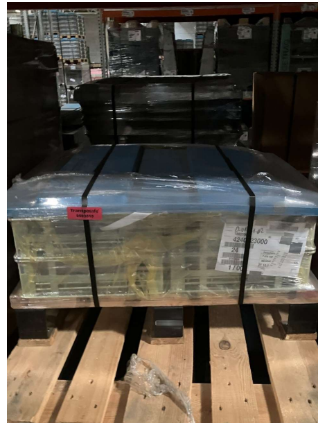
Bsp.23212333047_Räder_Europalette & KLT